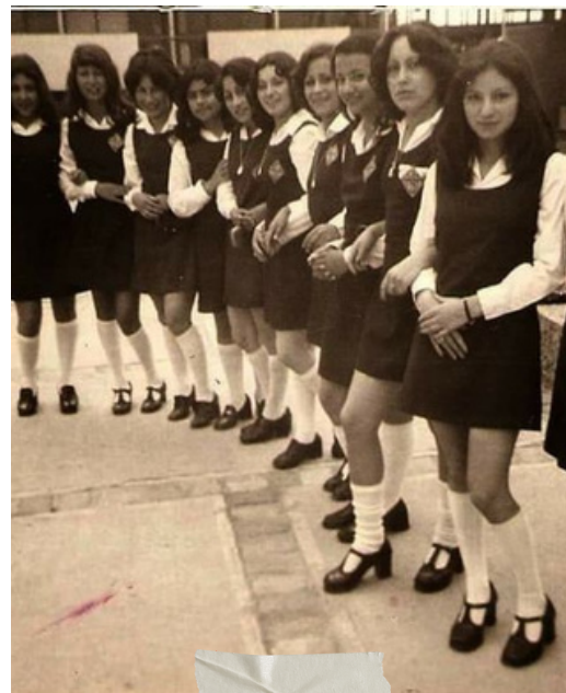
Vintage Schoolgirls