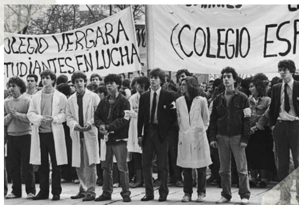
Imagen de la película que reconstruye la Noche de los lápices

-Están llegando los militares y ayer sus nombres estaban en lista, corran por favor.