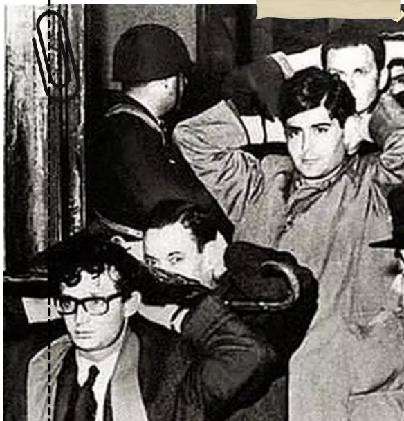
Noche de los Bastones Largos

Primer día de facultad, primer día en el que decido que ponerme, cómo vestirme, como hablar y ser yo misma. ¿Así se siente la libertad? Es perfecta, no hay otra cosa que me haga tan feliz como eso. Usar pantalones es lo más cómodo del mundo, ¿cómo mi madre puede querer usar polleras todo el día? No le encuentro sentido, pero bueno, basta de pensar en ella, hoy comienzo a escribir mi historia, ya no hay límites para mí.