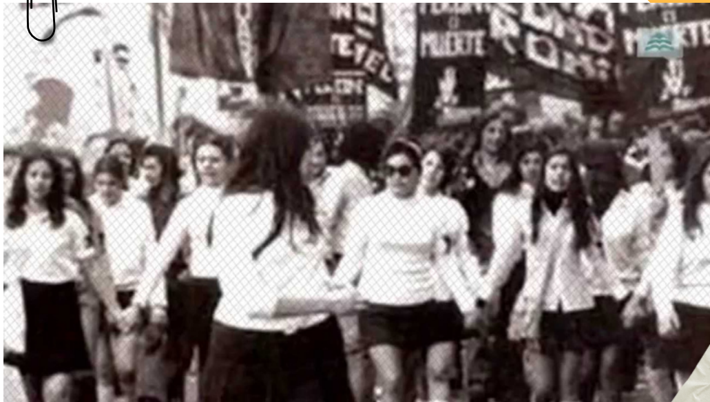
La noche de los lápices

No puedo entender el nivel de maldad que hay en la universidad. ¿No dejarme rendir porque estoy de 8 meses y puedo parir en cualquier momento? ¿qué clase de excusa es esa? No me interesa estar sola y que nadie me hable, entiendo que no sea cómodo hablar con una mujer que ya va por su tercer embarazo, tampoco los necesito, tengo una hermosa familia esperándome en casa, pero ¿cómo un profesor se va a atrever a decirme semejante cosa? Esta angustia opresora regresa y ahora aún más fuerte porque ya soy una adulta y no puedo llorar delante de los chicos.