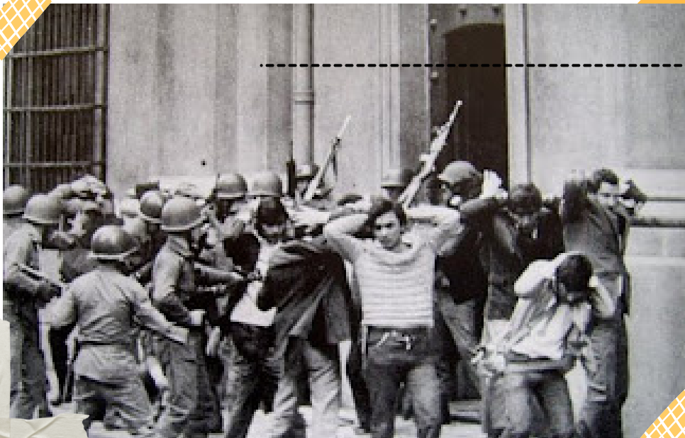
Golpe de Estado